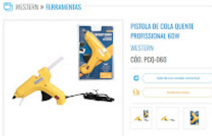
CATALAGO PISTOLA.jpeg 82K