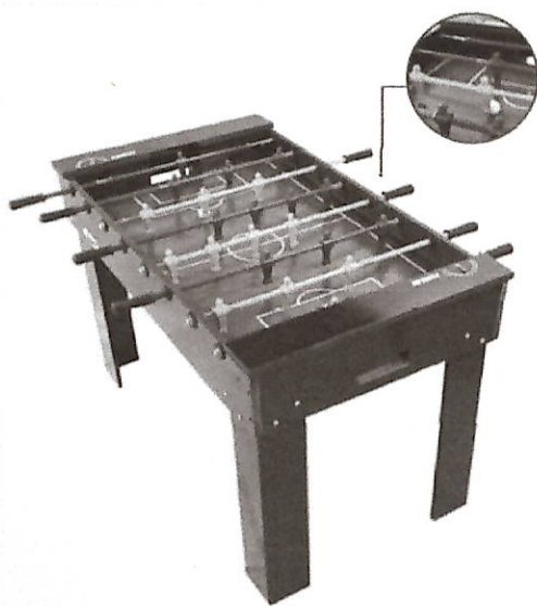
MESA DE PEBOLIM (TOTÓ) - ESPECIAL MODELO. 1071 (34 kg)

Modelo 1071 (Modelo ofertado pela Recorrente para atendimento ao item nº 25):